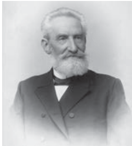
Brustbild von 1901, aufgenommen vom Kgl. Hof-Photograph Franz Werner. Der aus Augsburg stammende Franz Werner hatte das Photographenhandwerk bei Franz von Hanfstaengl erlernt und betrieb später in München selbst ein Atelier.

Zum ersten Vorsitzenden des Ärztlichen Bezirksverbandes in München wurde im Februar 1872 der damals 42-jährige Dr. Max Braun gewählt. Am 1. Dezember 1830 in München als